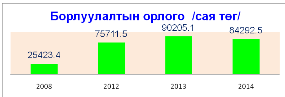
График 1.1. ААНБ-ийн борлуулалтын орлого /сая.төг/

Өмнөх оноос орлого 7 тэрбум зарлага 5,3 тэрбумаар тус тус буурсан байна. 2014 оны жилийн эцсийн нэгдсэн тайлангийн дүн мэдээг илтгэх хуудас бичиж аймгийн ЗДТГ-ын албан бичгээр хуулийн хугацаанд Сангийн яаманд хүргүүлэв.