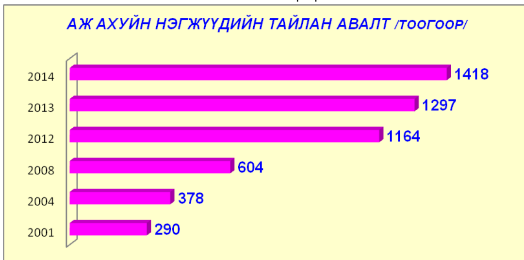
График 1.1. ААНБ-ийн тайлан авалт /тоогоор/

ААНБ-ын 2014 оны жилийн эцсийн нэгдсэн тайлангийн дүн мэдээг илтгэх хуудас бичиж аймгийн ЗДТГ-ын албан бичгээр хуулийн хугацаанд Сангийн яаманд хүргүүлэв.